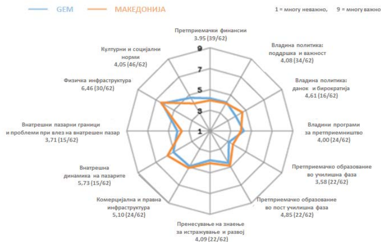
Слика 1. Позицијата на главните македонски индикатори во ГЕМ истражувањето за 2015 и 2016 (ГЕМ Report 2015-2016: стр 89)

На сликата 1 е претставена позицијата на Македонските индикатори во однос на 62 земји учеснички во истражувањето. Може да се согледа дека Македонија е најдобро рангирана во областа на Внатрешна пазарна динамика (15/62) и владини политики (16/62) . За потребите на овој труд ќе ја споменеме релативно добрата позиција на Македонија во однос на претприемачкото образование на ниво на училиште (основно и средно) со индекс од 3.56 (22/62) , како и за индикаторот претприемачко пост-училишно образование – 4.85 (22/62) . И кај двата индикатори, Македонија е на 22 место од 62 земји, при што се согледува дека Македонскиот индекс е подобар од просечниот ГЕМ индикатор по овие димензии.